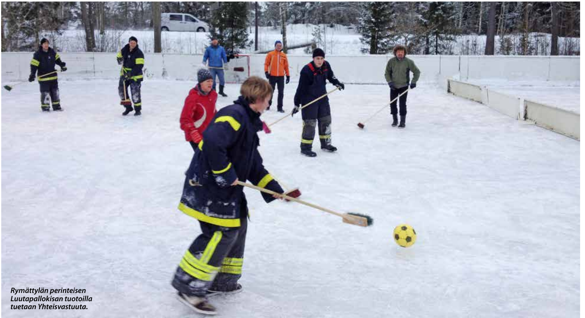
Rymättylän perinteisen Luutapallokisan tuotoilla tuetaan Yhteisvastuuta.